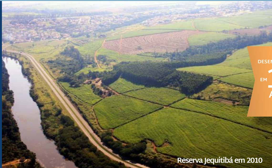
Reserva Jequitibá em 2010