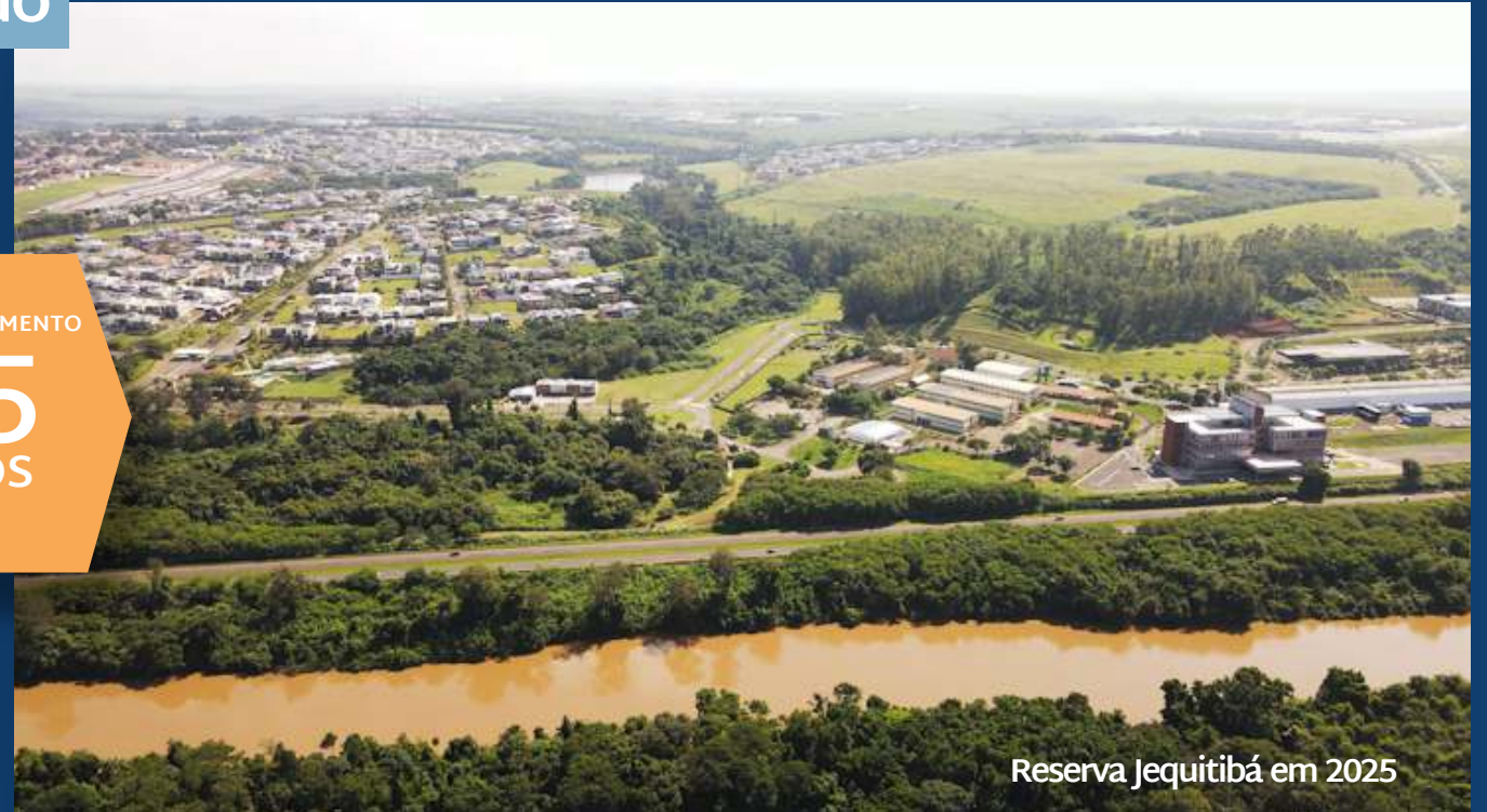
Reserva Jequitibá em 2025